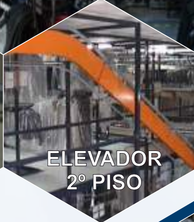
ELEVADOR 2º PISO